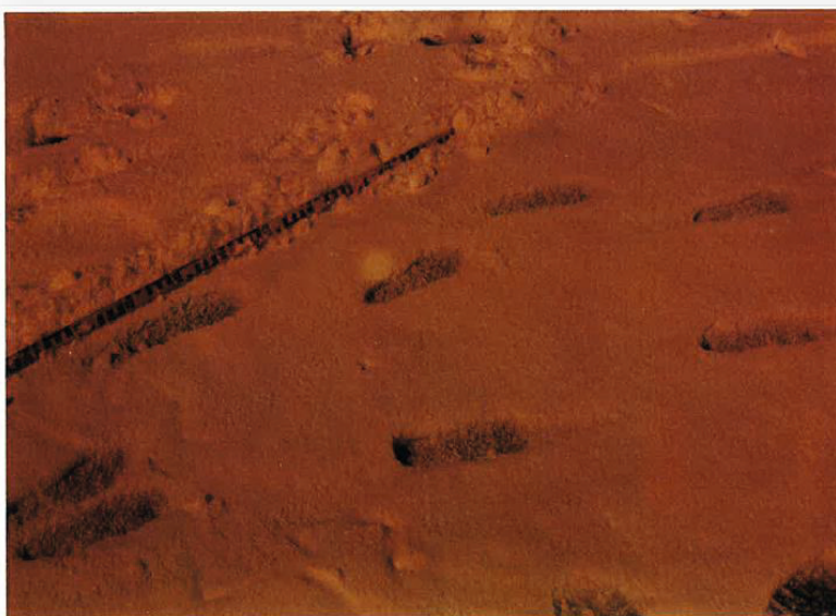
Fig. 31 Skrittlengden målt mellom bakre del av hælene, var uregelmessig, men såleavtrykkene ble målt til å være ca. 22 cm (+ / - 1 - 2 cm).

For det første er koblingen mellom klærne, avkledningen og Siljes skader etter mitt syn ikke bare preget av «egne vurderinger», men også løse koblinger. Hypotesen som det hele bygger på, forutsetter blant annet at Silje skal ha gått delvis naken - og uten sko - til stedet hun senere ble funnet død. Men, jeg kan ikke se av fotografiene av fotsporene, eller kriminalteknikernes beskrivelse av fotsporene, at noen av dem stammer fra et barn i bare sokkelessen. Snarere tvert imot beskrives sporene gjennomgående som «fottøyavtrykk» og «såleavtrykk». For eksempel som i figur 31: