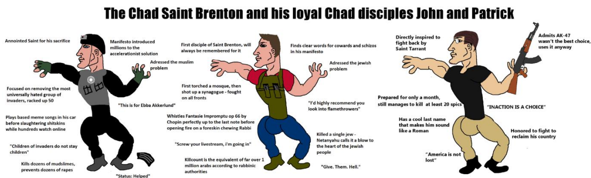
Figur 11. Meme som angivelig skal være postet av Manshaus på Endchan sammen med meldingen om det forestående angrepet.

Manshaus la ut et meme i posten på Endchan, som skal forestille «Chad» helgen Brenton (Tarrant) og hans «Chad» disipler John (Earnest) og Patrick (Crusius). Chad er slang for en attraktiv alfamann som er populær blant damene, og memer om han har blitt mye brukt i incel-miljøet. Også i det høyreekstreme miljøet har Chad blitt populær, hvor han presenterer et ideal for hvordan menn skal være. Chad er selve symbolet på maskulinitet, hvor han fremstilles som muskuløs og kjekk, og blir her brukt for å gi terrorister status i subkulturen. De blir sett på som ekte menn fordi de gjennomførte terrorangrep og drepte mennesker som representerer gruppens fiende. Det at Manshaus la ut denne memen tyder på at han så opp til disse terroristene og at han, ved å gjennomføre et likt angrep, håpet å få samme heltestatus som sine forbilder. Denne anerkjennelsen kan medlemmer i subkulturer oppnå da «intimate participation in a collective way of life demonstrates and displays, to oneself and to others, personal attributes that make one worthy of belonging, being accepted, and – potentially – becoming important» (Ferrell & Sanders, 1995, s. 4-5). Men akkurat som Tarrant ble hyllet for å gjennomføre et suksessfullt terrorangrep, ble Manshaus latterliggjort av mange på de samme forumene. Ikke bare mislyktes han med å drepe noen i moskéen, men han ble overmannet av to muslimske pensjonister. Mens Tarrant blir sett på som en kriger og en helgen, blir Manshaus sett på som en taper og en «wannabe».