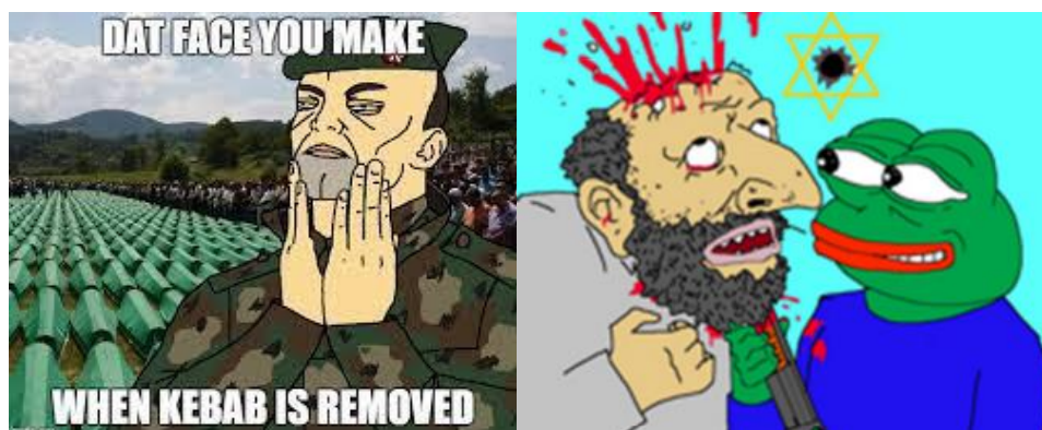
Figur 4 «Remove Kebab» og figur 5 «Pepe the Frog».

Denne trollingen i Tarrant sitt manifest har trolig flere årsaker. Først og fremst vil det føre til oppmerksomhet i media og sosiale medier, også utenfor chan-forumene, han vil underholde de som er «innenfor» og få deres anerkjennelse, og samtidig spre sitt budskap på en slik måte at han får mest mulig støtte og når ut til flest mulig. Memer fremstår ofte ikke som høyreekstreme, men ved hjelp av bricolage og homologi blir de det. Men det er ikke sikkert de «utenfor» forstår det. Ved å se på humoren og interne referanser som kulturell kapital, vil