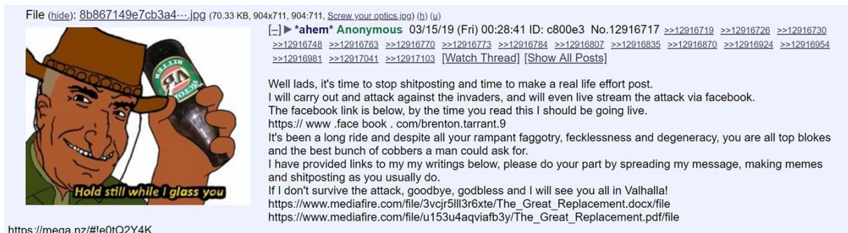
Figur 6. Innlegg angivelig publisert av Tarrant på 8chan før angrepet.

anses som den største mulige prestasjonen, som virkelig viser at man er en del av gruppen, er sensasjonelle terrorangrep mot fienden, som de kombinerer med underholdning for gruppen i form av interne referanser og vitser som kun de forstår.