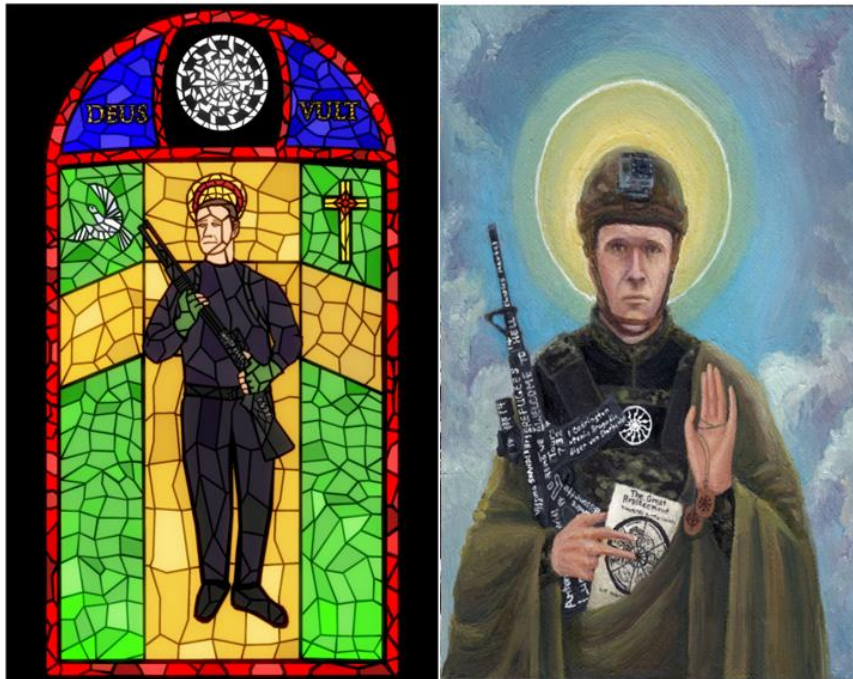
Figur 9 og 10. Ukjent opphav. Hyllester av Brenton Tarrant.