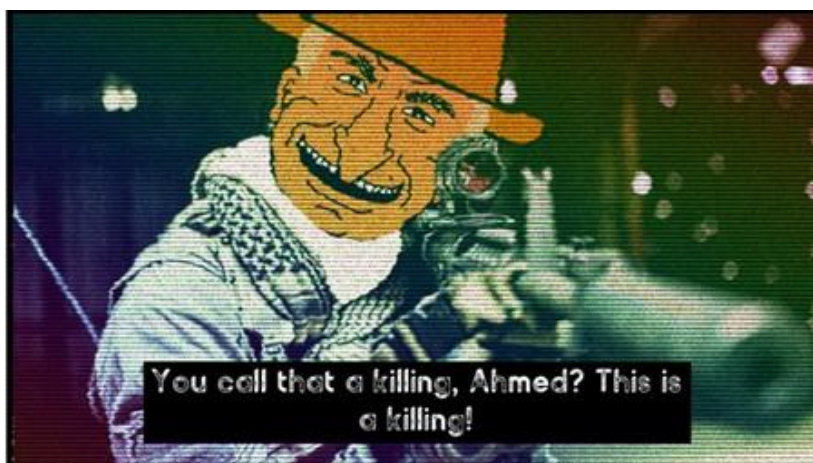
Figur 8. Ukjent opphav. Denne memen ble mye delt i månedene etter Tarrants angrep. Det er mye fokus på «bodycount» og «high score» på forumene i forbindelse med slike terrorangrep.

Disse angrepene inspirerer og oppmuntrer andre, som får stadig flere martyrer og helgener å etterligne, samtidig som at terskelen for å bruke vold blir lavere (Macklin, 2019b, 1). Ikke bare ønsker de å kopiere tidligere terrorister, men de ønsker å overgå dem, hvor terror blir som en konkurranse om å komme på «the leader board» (Macklin, 2019b, s. 2-3). Nacos (2009, s. 3) bruker «contagion theories» for å forklare en slik smitteeffekt, hvor individer imiterer vold som virker attraktiv, og som ofte blir popularisert i massemedia. Man kan ikke se på terrorangrepene som isolerte hendelser «but as part of a broader social process in which violence is enacted in reaction to, and in combination with, other actors» (Macklin, 2019b, s. 2). Etter Tarrant sitt angrep var det fire andre som gjennomførte terrorangrep i 2019, tydelig inspirert av han. «There seems to be a copycat process at play here, as a handful of prospective lone actor terrorists are emulating these «role models» (Bjørigo & Ravndal, 2019, s. 13). Ravndal et al. (2020, s. 21) påpeker at selv om det er mange som hyller terrorangrepene, er det også en del som hevder at de gjør det på en ironisk måte og ikke virkelig støtter terroristene. Dette bidrar like fullt til at sårbare mennesker kan ty til vold for å få denne anerkjennelsen, som for noen bare er underholdning (Ravndal et al., 2020, s. 21).