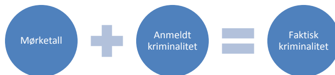
Figur 1 Faktisk kriminalitet består av anmeldt kriminalitet og mørketall

Et problem med kriminalitetsstatistikk er at den anmeldte kriminaliteten ikke er den faktiske kriminaliteten. Man har også mørketall. For å finne den faktiske kriminaliteten må man legge sammen mørketall og anmeldt kriminalitet (figur 1).