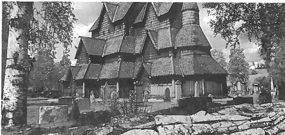
Kristenrettene på slutten av 1200-tallet bestemte at de som hadde tatt sitt eget liv ikke skulle gravlegges i kristen jord. I 1607 slo kirkeordinansen fast at "alle kristne" skulle begraves i kirkegård.

Det siste tiåret har det kommet en rekke europeiske arbeider om selvmord i middelalder og tidlig moderne tid. Folk flest vet at de gamle norske lover betegnet selvmord som en forbrytelse, og at selvmordere ble gravlagt utenfor kirkegården. Få er klar over at loven bestemte at selvmord også skulle straffes med konfiskering av eiendom. Man vet lite om hvordan lovene ble praktisert. Denne artikkelen gir et lite innblikk i hvordan norske myndigheter og enkeltmennesker reagerte på faktiske selvmordstilfeller i perioden 1536–1800. Den bygger på en større undersøkelse av norsk selvmordslovgivning og rettspraksis i samme periode (Ellefsen 1998).