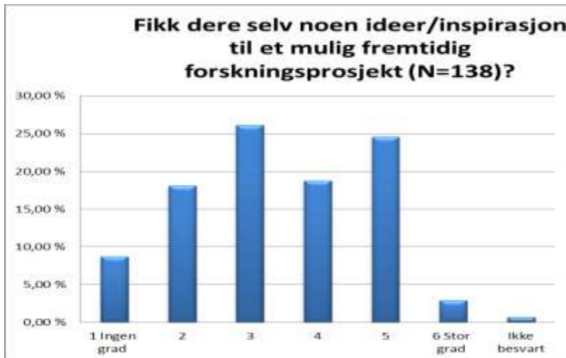
Figur 8. Det kan synes som om det er noen studenter som har fått en viss inspirasjon til å prøve ut liknende prosjekter