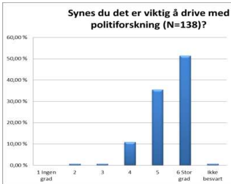
Figur 10. Majoriteten av studentene opplever politiforskning som relevant.